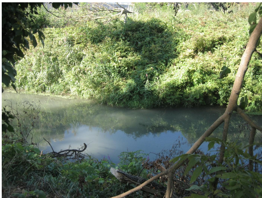
Vue du point de prélèvement physico-chimique