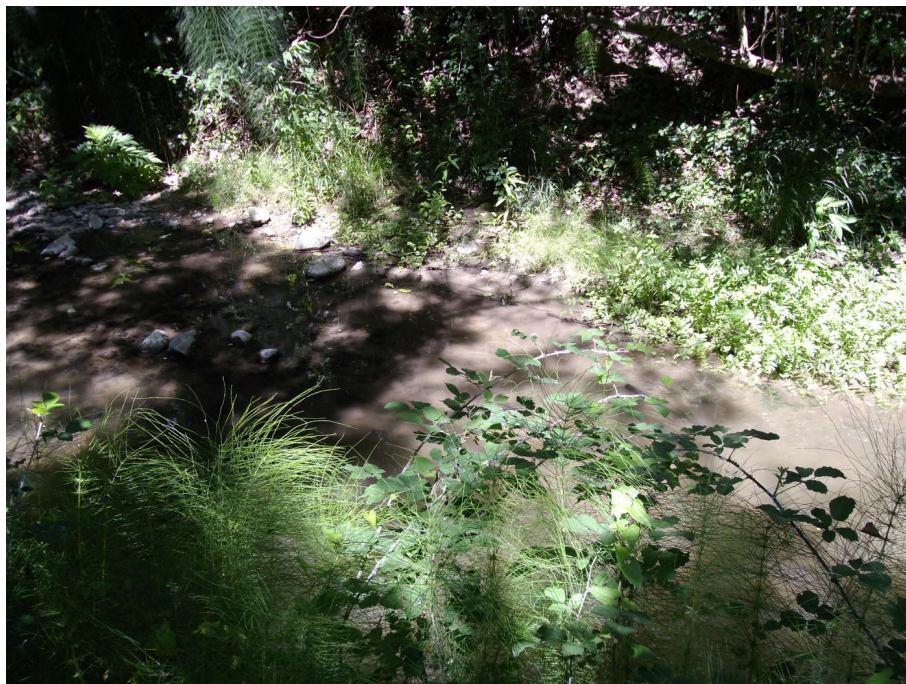
Vue du point de prélèvement physico-chimique