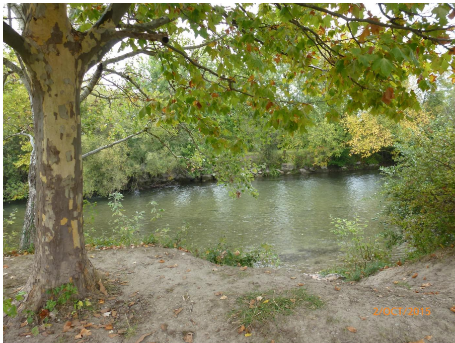
Vue du point de prélèvement physico-chimique