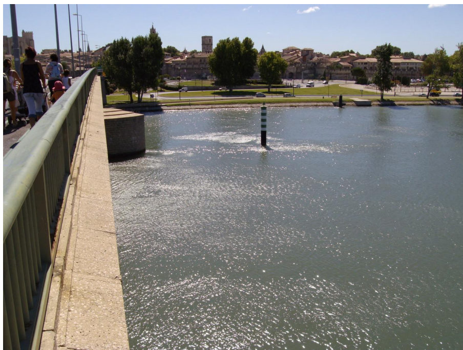
Vue du point de prélèvement physico-chimique