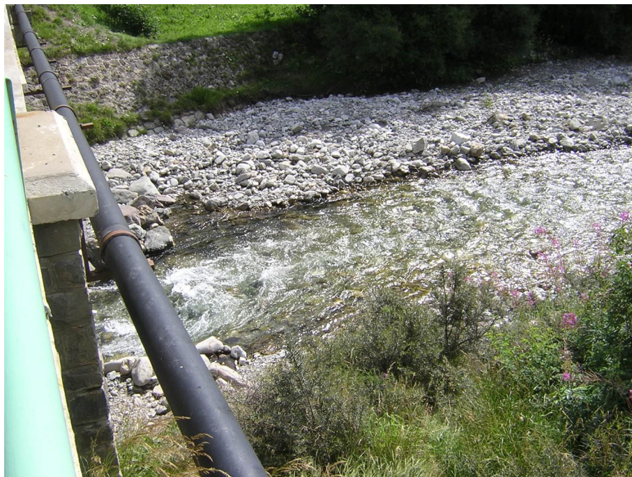
Vue du point de prélèvement physico-chimique