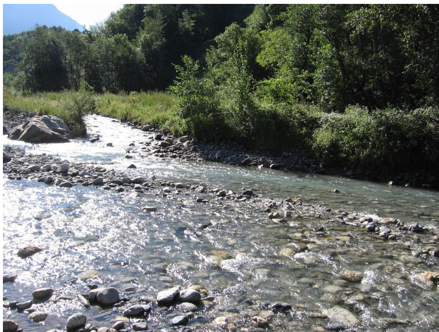
Vue du point de prélèvement physico-chimique