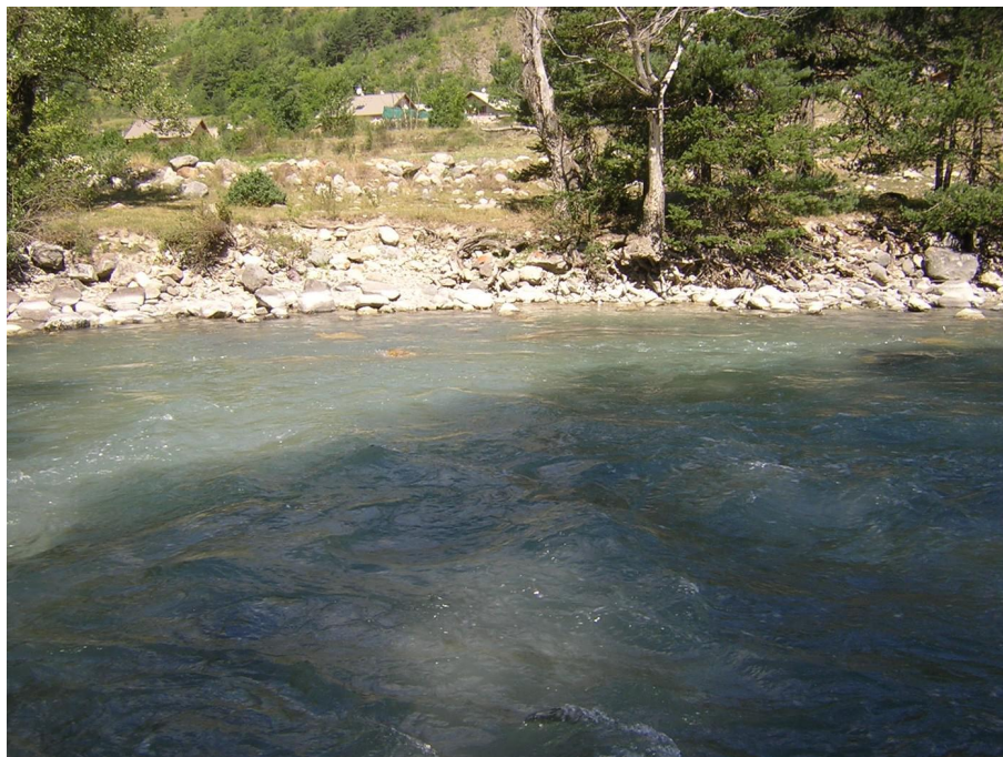
Vue du point de prélèvement physico-chimique