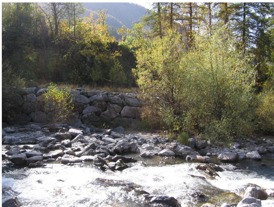
Vue du point de prélèvement physico-chimique