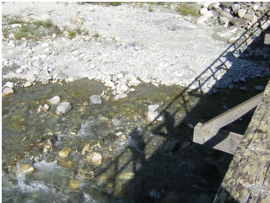
Vue du point de prélèvement physico-chimique