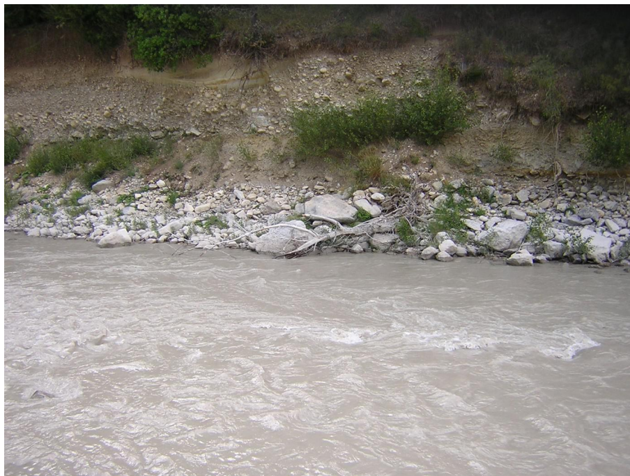
Vue du point de prélèvement physico-chimique