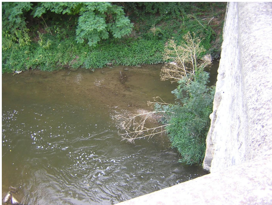
Vue du point de prélèvement physico-chimique