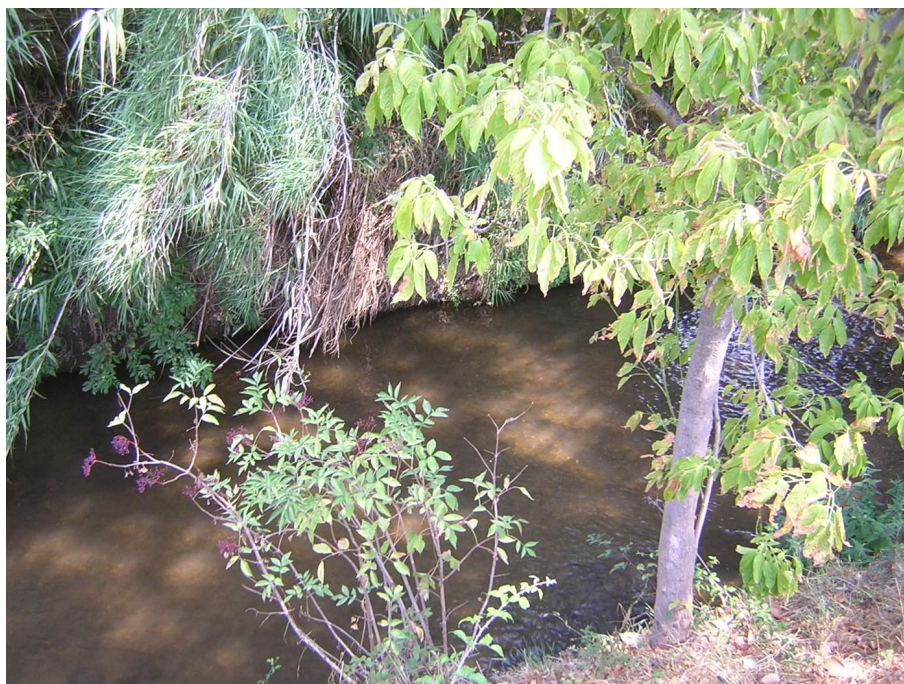
Vue du point de prélèvement physico-chimique