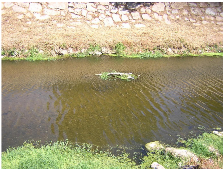
Vue du point de prélèvement physico-chimique