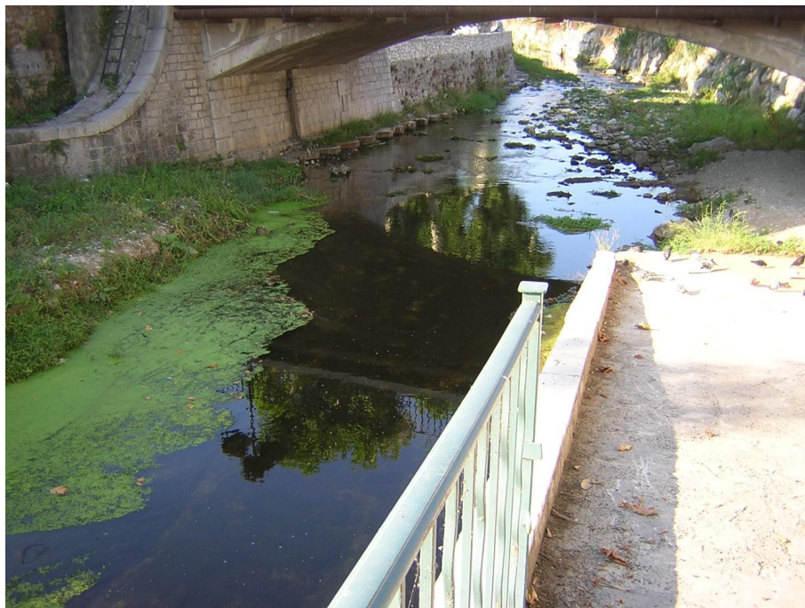
Vue du point de prélèvement physico-chimique