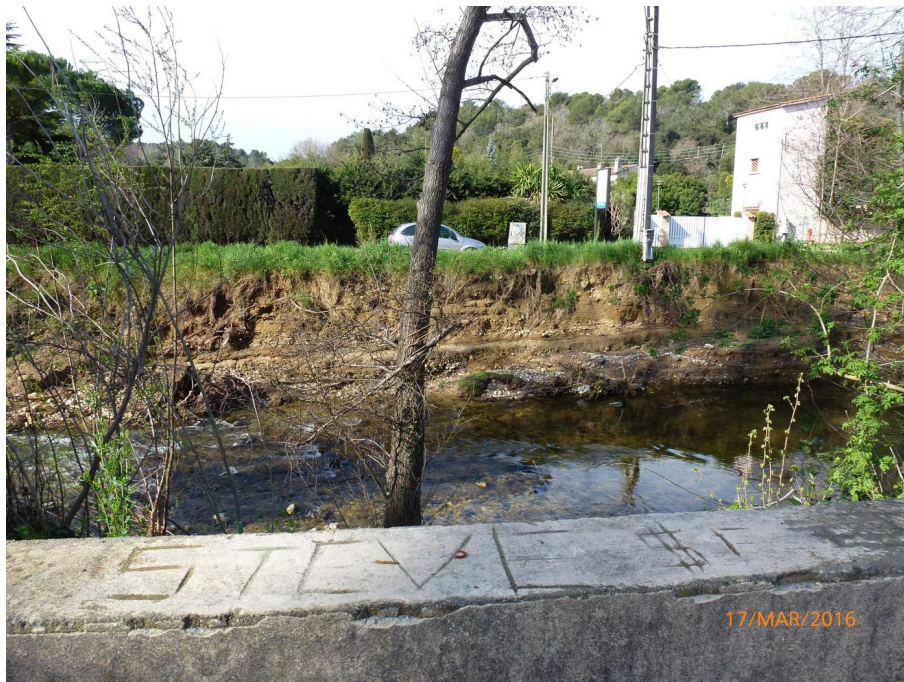
Vue du point de prélèvement physico-chimique