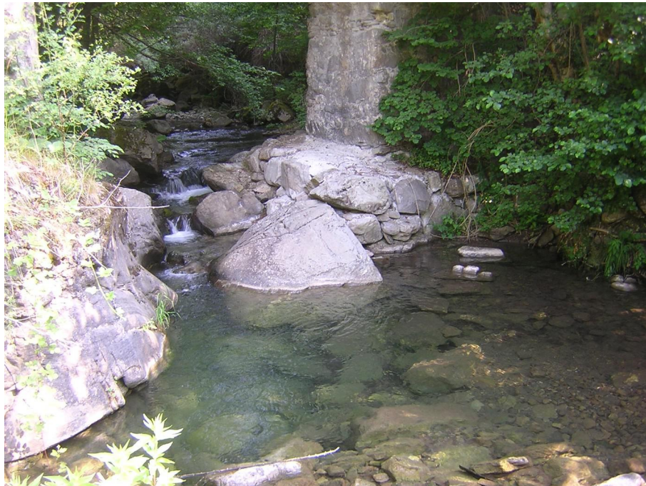
Vue du point de prélèvement physico-chimique