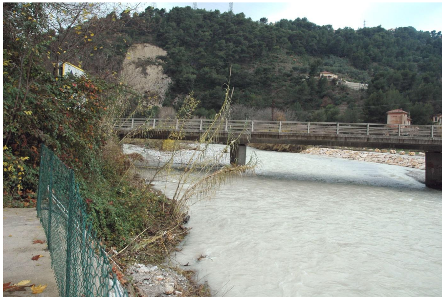
Vue du point de prélèvement physico-chimique