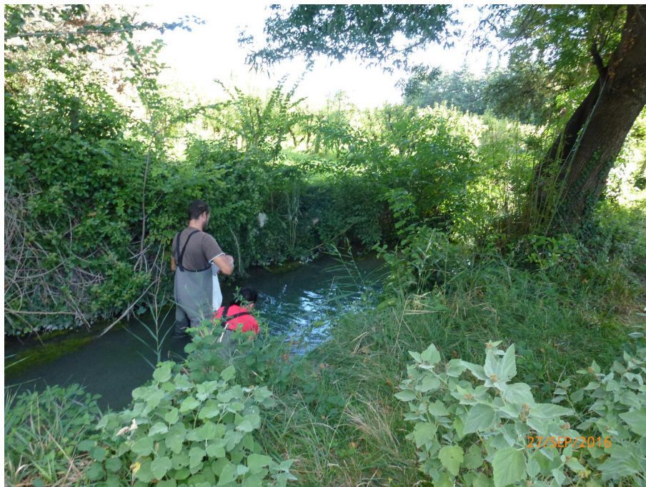
Vue du point de prélèvement physico-chimique