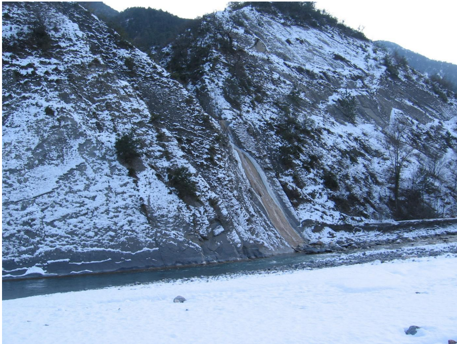
Vue du point de prélèvement physico-chimique