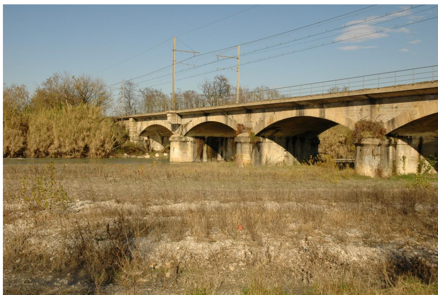
Vue du point de prélèvement physico-chimique